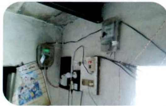
एक ही ग्रामीण परिवार के घर में स्थापित दो मीटरों को दर्शाने वाला चित्र

दोनों योजनाओं के अन्तर्गत परियोजनाओं के पूर्ण किये जाने की निर्धारित तिथियां क्रमशः सितंबर 2015 और मार्च 2017 में समाप्त हो गईं। तथापि, 41.21 लाख संयोजन के लक्ष्य के सापेक्ष मात्र 11.56 लाख (28.05 प्रतिशत) बीपीएल संयोजन प्रदान किए गए थे, एवं मार्च 2017 तक 29.65 लाख बीपीएल परिवार (71.95 प्रतिशत) अभी भी विद्युत तक पहुंच से वंचित थे। बीपीएल संयोजन अवमुक्त करने के लक्ष्य की प्राप्ति न होने का मुख्य कारण, कार्यों को प्रदान करने, ठेकेदारों द्वारा वास्तविक स्थल सर्वेक्षण एवं ठेकेदारों द्वारा सामग्रियों की आपूर्ति में विलम्ब इत्यादि थे।