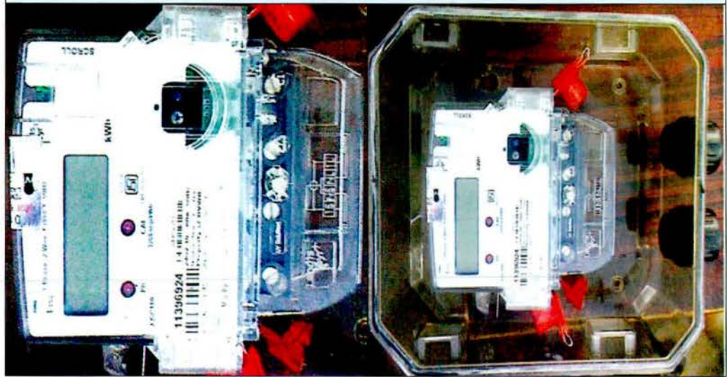
स्वतः बंद होने की व्यवस्था वाले चोरी-मुक्त मीटर बॉक्स

उत्तर प्रदेश विद्युत प्रदाय संहिता, 2005 (प्रदाय संहिता), अन्य विषयों के साथ, यह प्रदान करता है कि विद्युत के विपथन, चोरी या अप्राधिकृत प्रयोग या मीटर से छेड़छाड़, संकट या क्षतिग्रस्त होने से बचाने के लिए अनुज्ञप्तिधारी 5 द्वारा चोरी-मुक्त मीटर बॉक्स की व्यवस्था करना अनिवार्य है। छेड़छाड़ (चोरी) मुक्त मीटर बॉक्स एक पारदर्शी प्लास्टिक खोल में एकीकृत रहता है, यदि मीटर बॉक्स खोला जाय तो यह टूट जाता है, ऐसी सम्भाव्यता में, कार्यशील मीटर होने के बावजूद भी सम्पूर्ण मीटर बॉक्स को बदलने के अलावा कोई विकल्प नहीं बचता है। मीटर और बॉक्स दो अलग-अलग इकाईयां हैं एवं खुली निविदा के माध्यम से अपनी सम्बन्धित तकनीकी विशिष्टियों के विरुद्ध पृथक-पृथक क्रय किये जाते हैं।