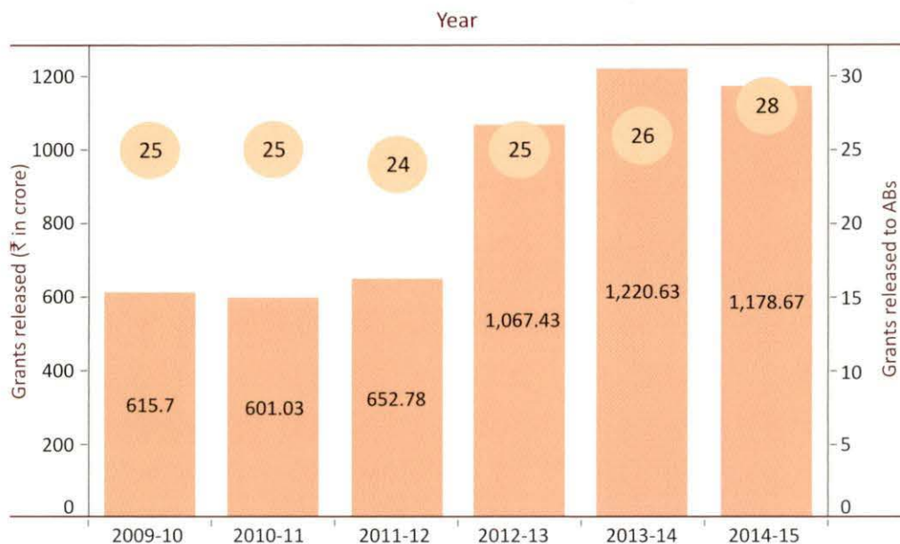
चार्ट 1: डीएसटी द्वारा स्वायत्त निकायों को जारी किया गया अनुदान

सरकारी अनुदान से इन स्वायत्त निकायों को मुहैया कराए गए पर्याप्त सहायता उनके कार्यों को करने में सरकारी नियमों व निर्देशों के अनुपालन को अनिवार्य बनाता है।