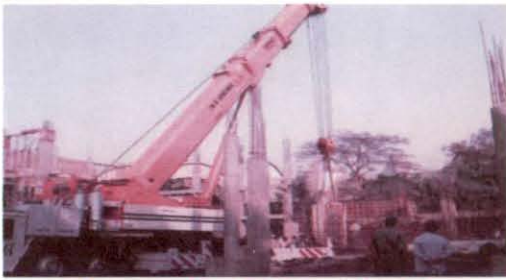
आई.एफ.आर.टी. में सिविल कार्य प्रगति पर

ब्रिट ने मार्च 2003 में दसवी योजना के दौरान "विकिरण प्रौद्योगिकी हेतु एकीकृत सुविधा" (आई.एफ.आर.टी.) नामक एक परियोजना 9.10 करोड़ रुपये की अनुमानित