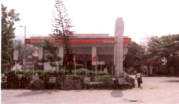
पेट्रोल पम्प, देवनार

बढ़ाने से संबंधित मामले को आई.ओ.सी.एल. के साथ बातचीत करने के लिये भी