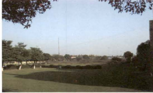
आई.सी.पी.ओ. सैक्टर 39 नोएडा में अनपयोग जगह