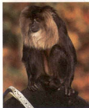
लायन टेलड मकौऊ

निधि सी.जेड.ए. को चिडियाघरों के विकास के लिए