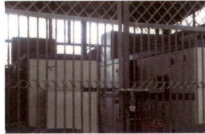
आई.सी.एम.आर. के डीजल जनरेटर

आई.सी.एम.आर. ने अपने मुख्यालय के वर्तमान स्वीकृत 368 के डब्ल्यू विद्युत भार के अतिरिक्त 500 के वी ए के अतिरिक्त भार की पूर्ति के लिये 2000 में एन.डी.एम.सी. की ओर रुख किया। एन.डी.एम.सी. ने मई 2001 में आई.सी.एम.आर. को अतिरिक्त भार के लिये अपने विद्युत उप-स्टेशन, आवश्यक उच्च टेंशन/कम टेंशन स्विच गीयर संशोधनों के साथ, निर्माण करने की सलाह दी। दसवीं योजना में, उप-स्टेशन के निर्माण के लिये रुपये 50 लाख का प्रावधान होने के बावजूद, आई.सी.एम.आर. ने अगस्त 2008 तक उप-स्टेशन का निर्माण नहीं करवाया। इसी बीच, आई.सी.एम.आर. ने रुपये 0.92 करोड़ की कुल लागत पर मैसर्स एन.पी.सी.सी. के माध्यम से सितम्बर 2007 में छः पॉटा केबिन (अस्थायी ढांचे) का निर्माण करवाया। अतिरिक्त भार के लिये उप-स्टेशन न लगने के कारण, आई.सी.एम.आर. ने जी.एफ.आर. के अंतर्गत