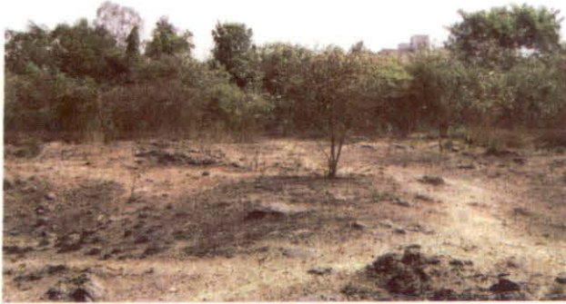
पूणे की भूमि

प्रगतिशील संगणना विकास केन्द्र (सी-डेक), भारत सरकार के सूचना एवं प्रौद्योगिकी विभाग के अर्न्तगत एक स्वायत्त वैज्ञानिक सोसाइटी है। यह सुपर कम्प्यूटर और सुपर कम्प्यूटिंग के डिजाईन और विकास के लिए भारत सरकार की एक राष्ट्रीय पहल है।