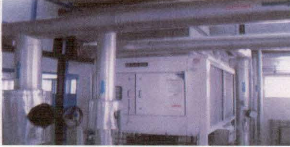
आर.ए.आई.एफ. में निर्मित क्लीन रूप फैसिलिटी

नवम्बर 2003 में डी.ए.ई. ने दसवी योजना के दौरान "रिवैम्पिंग एंड ऑगमेंटेशन ऑफ इन्फ्रास्ट्रक्चरल फैसिलिटीस(आर.ए.आई.ई.एफ.) नामक परियोजना 12.12 करोड़ रुपये की लागत से संस्वीकृत की जो कि अक्टूबर 2007 तक पूर्ण होनी थी। इस परियोजना