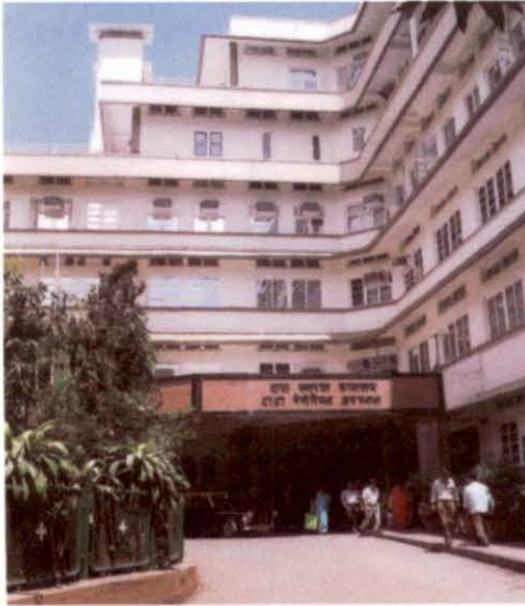
टाटा मैमोरियल अस्पताल

मुम्बई में स्थित टाटा मैमोरियल सैन्टर (टी.एम.सी.) परमाणु ऊर्जा विभाग (डी.ए.ई.) द्वारा वित्तपोषित स्वायत्त संस्थानों में से एक है। टी.एम.सी. में टाटा मैमोरियल अस्पताल (टी.एम.एच.) और कैंसर रोगियों पर शोध, शिक्षण और उनके विस्तृत इलाज के कार्यरत ए.सी.टी. शामिल हैं। टी.एम.एच. के स्टॉफ डॉक्टर आर.ई.सी. अपनी श्रेणी और डी.ए.ई. स्थापना में उसी प्रकार के, अपने ग्रेड में लागू क्षातिपूर्ति के पात्र हैं। उनके पारिश्रमिक के अलावा, नियमों के अधीन स्वीकार्य प्रैक्टिसबंदी भत्ते (एन.पी.ए.) के पात्र हैं।